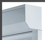
Coffre pan coupé